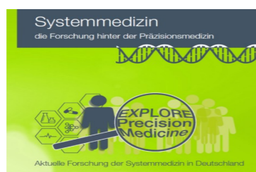
"Broschüre Von Big Data zur personalisierten Medizin"